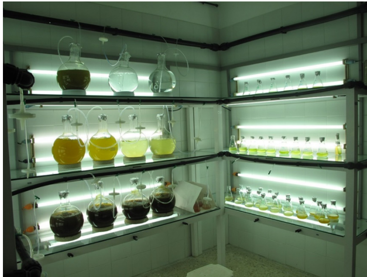
Imagen 1. Control de temperatura en el cultivo in vitro de algas.

Todas las plantas tienen una temperatura o punto óptimo de temperatura para crecer y desarrollarse, en la naturaleza esta variable está relacionada o depende de la hora del día, del tiempo o época del año, por ejemplo, en lugares que tienen las cuatro estaciones la temperatura varía dependiendo si es primavera; verano; otoño e invierno. Diferente en países tropicales como Colombia que solo se tienen un tiempo seco y un tiempo lluvioso.