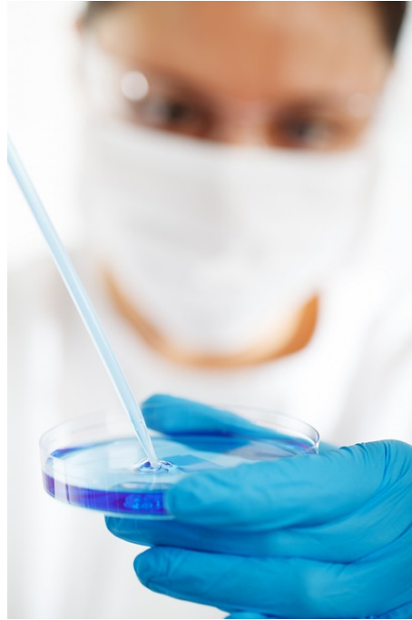
Foto 2. Biology research (2013)

Las condiciones de cultivo, son esos parámetros fisicoquímicos que se pueden controlar manual o automáticamente durante el proceso de crecimiento de los tejidos o explantes, en el laboratorio y que afectan la respuesta o el crecimiento de los mismos.