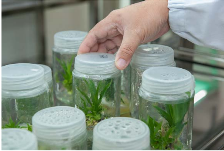
Foto 1. Plant Tissue Culture Facility, (2017) Recuperado de: pixabay.com , el 7 de junio de 2018.

El cultivo in vitro de tejidos vegetales, se basa en tomar una porción de planta que llamaremos explante, para sembrarla en un recipiente que contiene un medio de cultivo estéril con nutrientes y elementos necesarios para el crecimiento del explante, el cual puede ser cualquier parte de una planta como semillas, hojas, raíces y tallos.