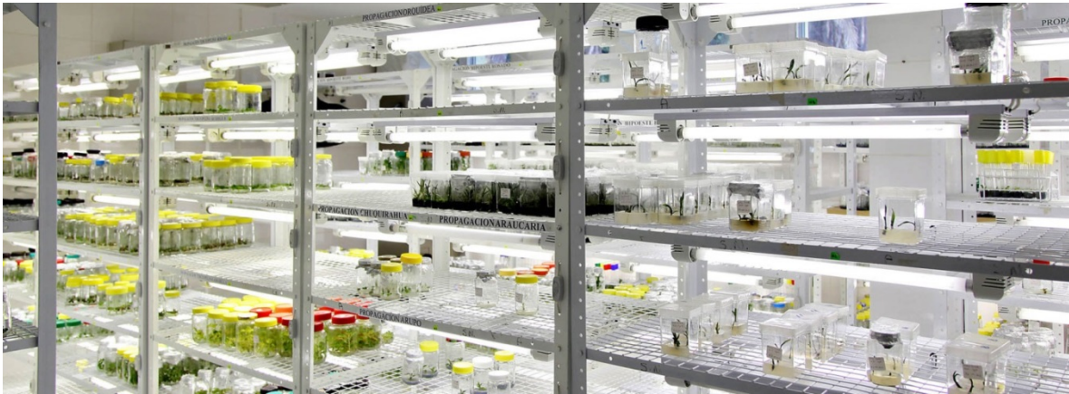
Imagen 2. Fotoperiodo en el laboratorio.

Recuperado de: agronomiasustentable.wordpress.com , el 17 de enero del 2018.