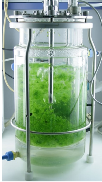
Imagen 5. Bioreactor.