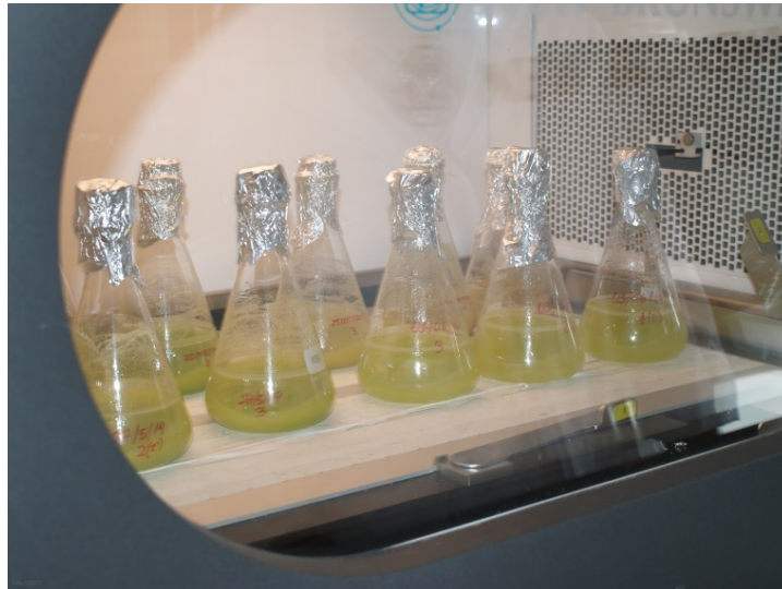
Imagen 4. Células cultivadas en medio líquido.